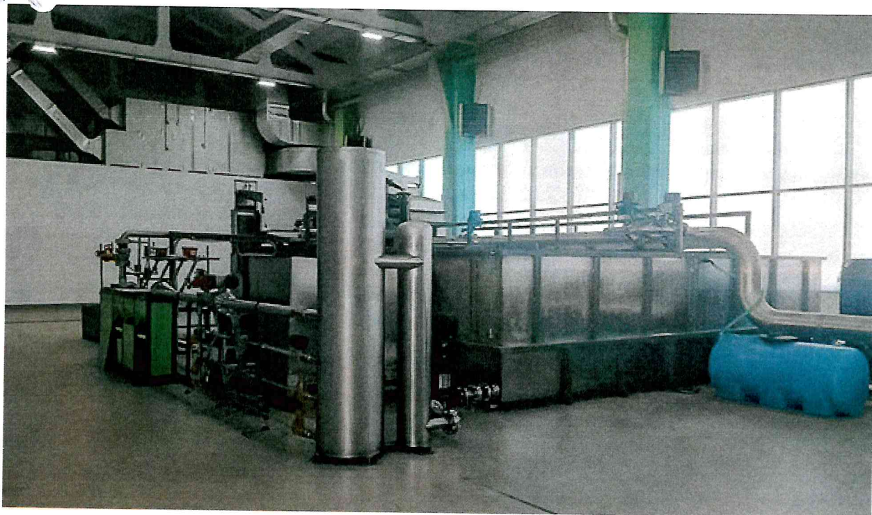
Рисунок 1 - Общий вид установок поверочных Эрмитаж

Пломбировка установок поверочных Эрмитаж осуществляется с помощью свинцовой (пластмассовой) пломбы и проволоки, которой пломбируется фланцевые соединения расходомеров установки, с нанесением знака поверки на пломбу. Средства измерений условий окружающей и измеряемой сред пломбируются в соответствии с описанием типа на конкретное средство измерений. Места пломбирования фланцевых соединений расходомеров установок поверочных Эрмитаж приведены на рисунке 2.